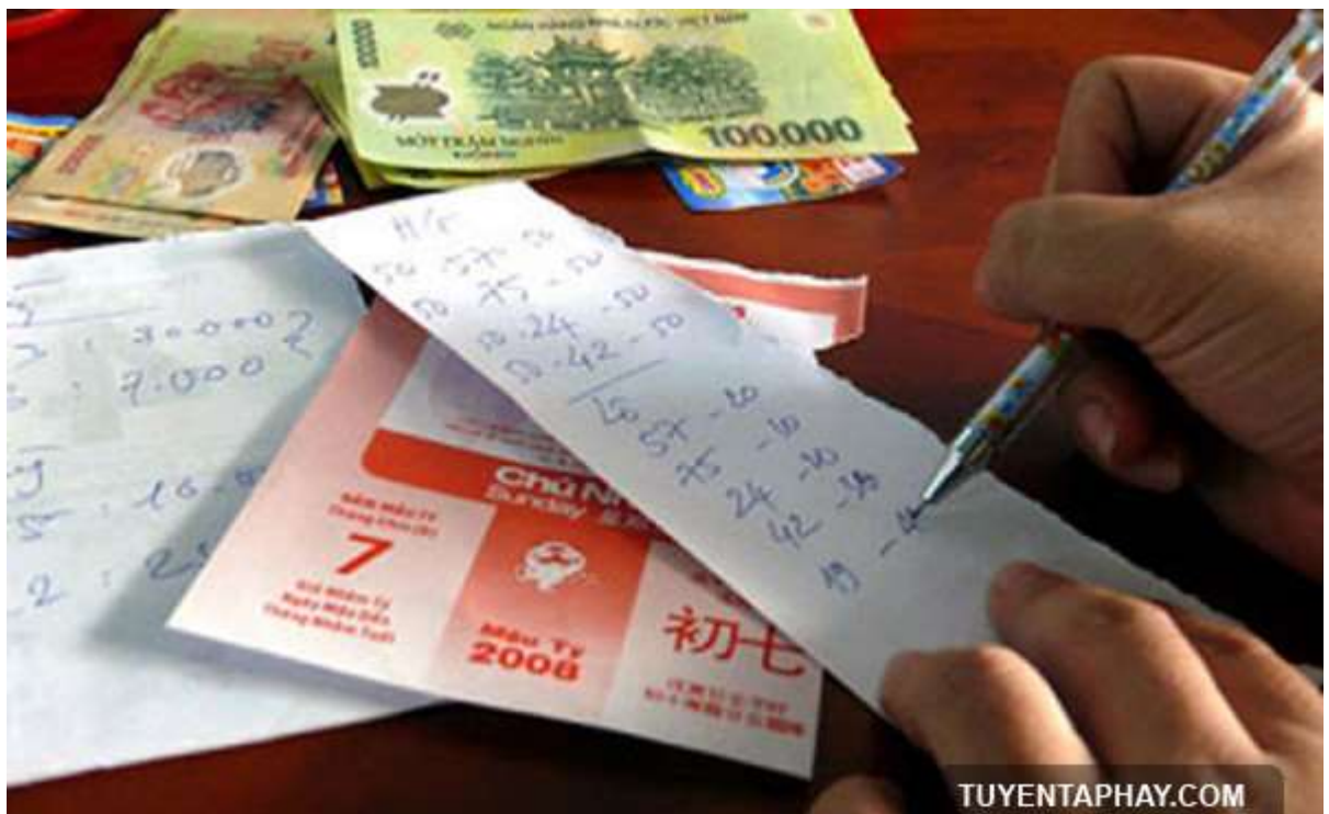
Hình 4: giấy tích kê ghi lô đề