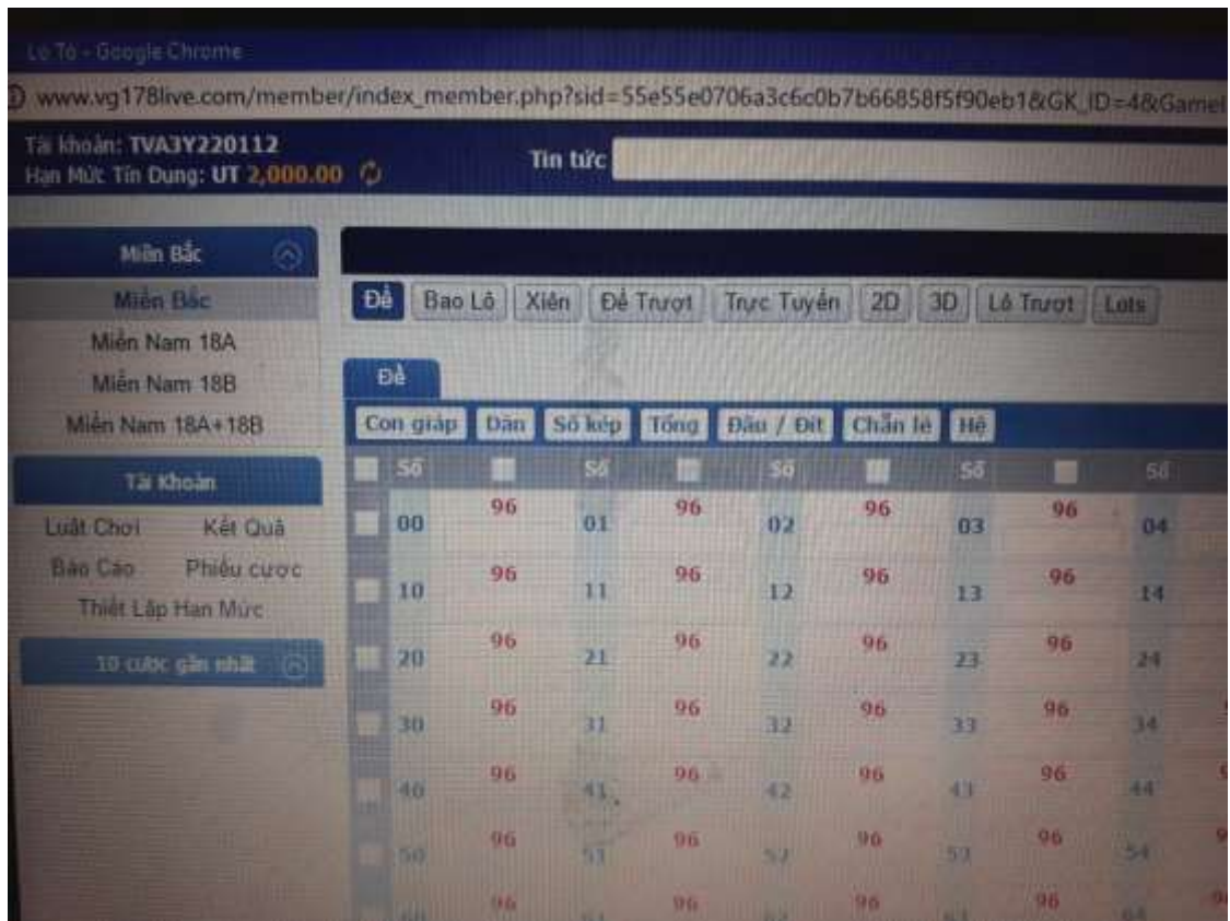
Hình 3: một trang web của một chủ lô đề