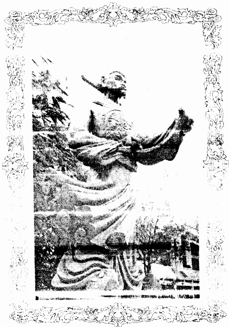
Tượng Lương quốc Trạng nguyên Mạc Đĩnh Chi tại trường PTH Mạc Đĩnh Chi- Thành phố Hồ Chí Minh

Khoa thi Giáp Thìn (1304), thi Hội, Mạc Đĩnh Chi đỗ Hội nguyên, thi Đình ông được chấm đỗ Trạng nguyên, nhưng khi vào ra mắt nhà Vua, vua Trần Anh Tông thấy ông tướng mạo xấu xí, có ý không muốn cho ông đỗ đầu. Biết ý, ông đã làm bài thơ Ngọc tỉnh liên phú . Đó là bài phú bằng chữ Hán để gửi gắm chí khí của mình. Bài phú đề cao được phẩm chất trác việt và phong thái cao quý của một người khác thường,