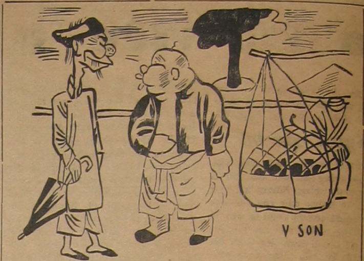
XỆ XÀ — Sao họ bán bánh rán lại phải che cái lưới sắt ra ngoài thế nhỉ bác Lý ? LÝ-TOET. — Sao bác ngờ ngẩn thế, để họ che vì trùng chửi sao ?

Đó có lẽ là một dấu vết xưa còn lại, và có thể chứng rằng tiếng « hắn »