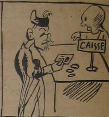
... VI TIỀN

— Có tài hẳn đi chứ lại ! Vây, tiểu thuyết ông viết có nhiều cũng là tác phẩm tài tình của người có tài.