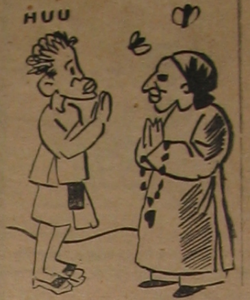
- Bạch sự cụ đèn điện ở xe đạp gọi là gì? - Là đèn di-na-mô chứ gì?