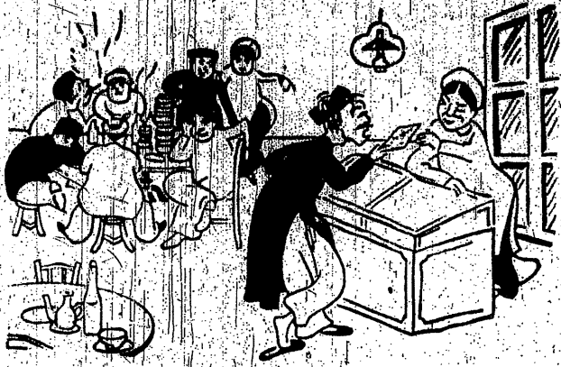
Trở đạo nhiều lại đau lòng bấy nhiêu, Xót mình đả đứ đả nhiều...